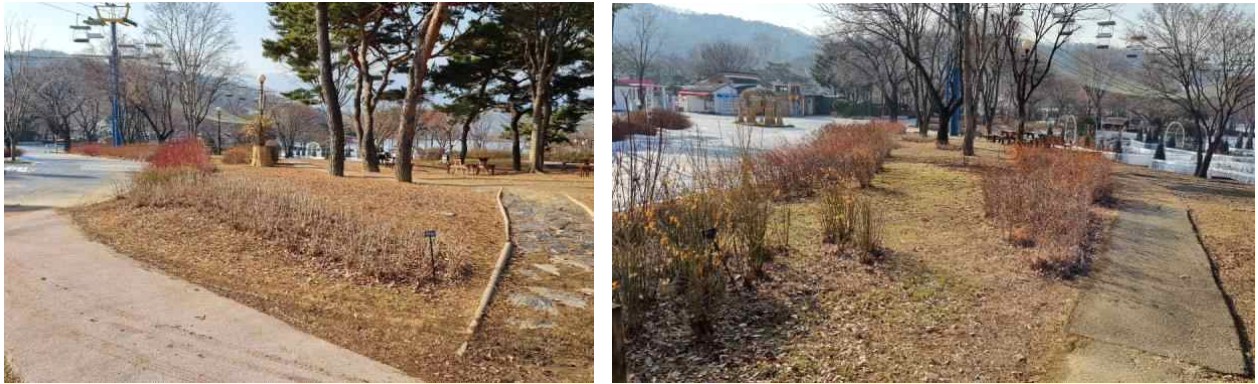
대상지(참가팀은 '1.8m×1.8m'의 정원 설계안을 제출)